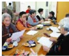
懐かしいメロディーを口ずさむ皆さん

「ふれあい・いきいきサロン」は、高齢者や障害者、子育て中の親などが身近な場所に気軽に集って、お茶を飲みながらおしゃべりしたり、ゲームをしたり、歌ったり、何をやってもやらなくても楽しく過ごせる「たまり場」のようなところです。昭和区内では