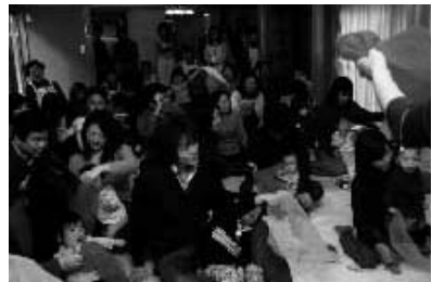
布を使った遊びで楽しむ親子(滝川学区)

昭和区内には11の学区があります。各学区では、学区福祉推進協議会が、それぞれの特性や実情に応じたさまざまな活動の助成を行っています。