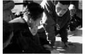
福祉に興じるひととき

あってもいいよ」との言葉が出るほど。会では、保育園を訪問したり、あるいは福祉を学ぶ学生を研修のために受け入れるなどして、世代間の交流も行っていきます。