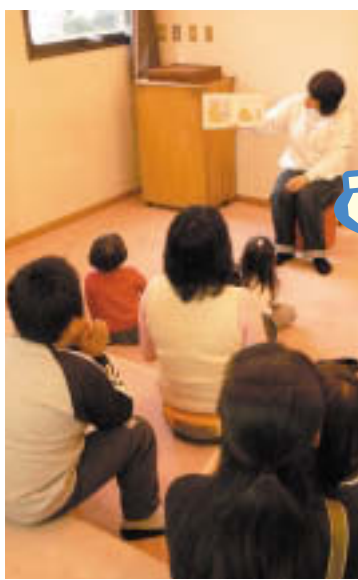
真剣に聞き入る子どもたち