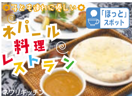
「ほっと」スポット ネパール料理、デザートがセットになった「ランチコースC」(1260円※平日の場合)