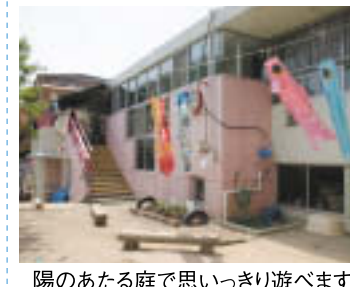
陽のあたる庭で思いっきり遊べます