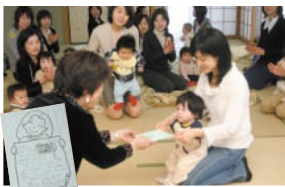
人生最初の卒業証書授与式!(ブチトマト)

子育てに悩みはつきもの。身近に相談できる相手がない方・ひとりでお子を抱えている方にとっては、ストレスの多い毎日になってしまします。「育児に関する情報を知りたい」、「子どもの遊び相手を手がほしい」、「ママ友がほしい」、「ママ友とリフレッシュしたい」などと思われる方は、子育てサロンや子育てグループに参加してみようではないでしょうか。(保健所で昭和三育子育てグループマップを入手できます)。