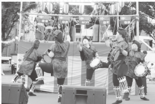
エイサー（沖縄舞踊）

利用者が楽しめることを、ハンディのある人がきらきら輝けることを願ってというコンセプトは、10年前の設立当初から今も変わっていません。振り返ってみたら、地域の人にも喜んでもらえるエイサー（沖縄舞踊）を披露できるようになっていたそうです。