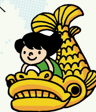
世界会議マスコットキャラクター