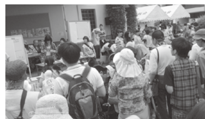
▲ビンゴゲームも楽しみました

7月18日(土)17:30～ 暑気払い(盆踊り・模擬店ほか) 毎年、御器所女性会の皆さんが盆踊りのご指導をさせていただきます。地域の皆さまもぜひ参加してお楽しみください。詳しいことはAJUのホームページで http://www.aju-cil.com/