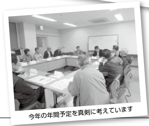
今年の年間予定を真剣に考えています