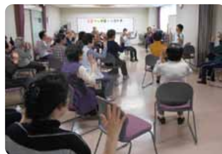
笑顔があふれる体操風景です

お住まいの近くで、近隣の仲間と一緒にあれば通い続けられる。顔なじみが増えることで地域で安心して暮らせることを願って、村雲学区の支援のもと、参加者が主体となって活動しています。講師による体操を1時間、健康講座を30分行っていきます。