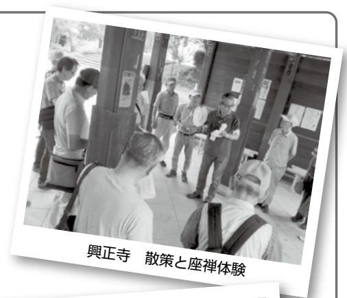
興正寺 散策と座禅体験

(おやし会はおやし塾の卒業生で構成しています。今年のおやし塾へのご参加をお待ちしています)