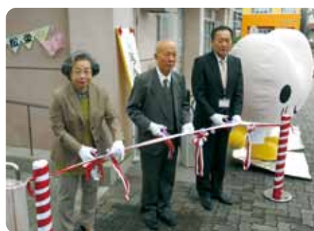
4月8日 オープニングセレモニーでのテープカットの様子

問い合わせ先：昭和区西部いきいき支援センター 御器所交差点分室 ☎852-3355 担当：藤村・荒木