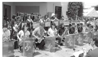
▲中部楽器技術専門学校の方々の演奏

「(障害者らが使う)車いすが、 「車輪の跡(地域参加・社会貢献)」を残す言葉“わだち”から