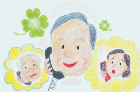
イラスト/久世 賀子さん(昭和区)

地域支えあい事業を実施していない学区の方で何かお困りごとがあれば昭和区社会福祉協議会までご相談ください。