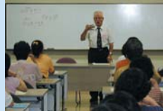
賛助会費で支えられている手話教室

個人会員 1口 1,000円(年額) 法人・団体会員 1口 10,000円(年額)