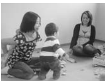
「子育てグリーンマップ」を作った親子に参加いただく

座談会に参加いただける親子を募集! 社協のお部屋で子どもたちを遊ばせながらワイワイ話してみませんか? 次号(8月頃座談会開催予定)のテーマは、「うちの子って食べ過ぎ? 食べなさ過ぎ?」