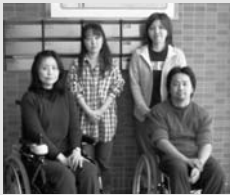
車で働くスタッフもいます

昭和区障害者地域生活支援センター「サポート」では、情報ターミナルとして障がいに関するあらゆる相談にに応じています。また「ピアカウンセリング」では、同じ障がいをもつカウンセラーが相談