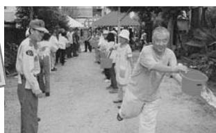
消防署のアドバイスのもとで行われた防災訓練