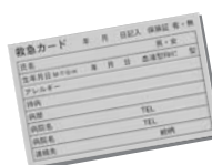
町内会で配られている救急カード

淡路大震災時のトイレの状況を知り、下水道のマンホールに設置する簡易トイレを試作。行政にかけあい、その必要性を認めてもらいました。普段から公園の清掃やパーベキュー大会などを通じ、地域の交流をはかっています。子どもの就学、成人式、敬老の記念に贈り物したり、また入院した場合には見舞金を渡します。こうした親密な関係を築くことで、いざというときにお互いに助け合