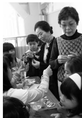
講師やアシスタント・パートナーのまわりは子どもたちでいっぱい

70代の地域ボランティアです。あらゆる学年がひとつの教室でともに地域の人とふれあうことで、普段の授業では得られないような体験をすることができま