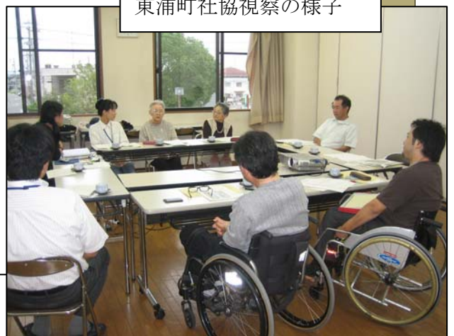
東浦町社協視察の様子