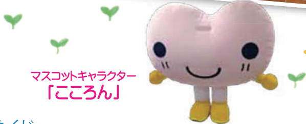
マスコットキャラクター 「こころん」

昭和区社会福祉協議会 マスコットキャラクター「こころん」 あたたかい心で福祉のタネをまく イメージから生まれました。