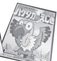
はげたかのえじき

地域でみんなが集まって何かしたいなって 思った時、社会福祉協議会で 保有しているゲームを お使いください!