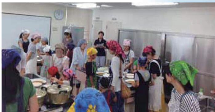
▲ふくし講座「いりようとかいごのおやこ探検隊」 親子でミルフィーユとんかつ作りの様子

「私たちが暮らす地域で、助け・助けられながら、ともに育ち、みんなが担い手になる」をテーマに「ふくし講座の開催」「福祉教育セミナーの開催」「学校で取り組む福祉教育の支援」「子育て見本市の開催」「子育てカレンダーの作成・配布」などの事業に取り組んできました。