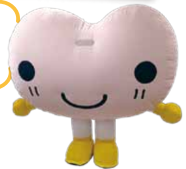
マスコットキャラクター「こころん」

電球の取り替えやゴミの運搬など、1人では対応が難しいちょっとした困りごとがありましたら、相談窓口へ(吹上公民館内開設)お越しいただくか、受付時間内に電話にてご相談ください。(詳しくは4~5ページへ)