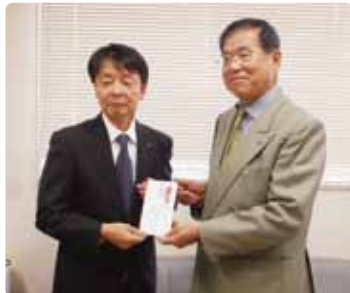
名古屋昭和ロータリークラブ様