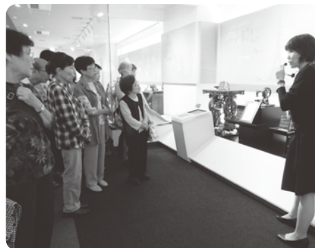
ブラザーミュージアムへ社会見学そのあとみんなで楽しくランチ!