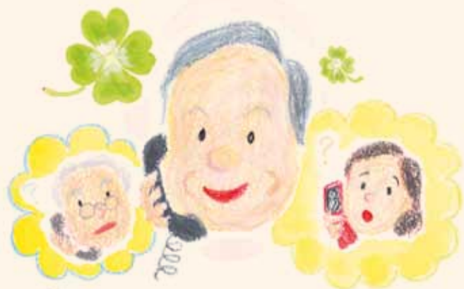
イラスト／久世 賀子さん(昭和区)