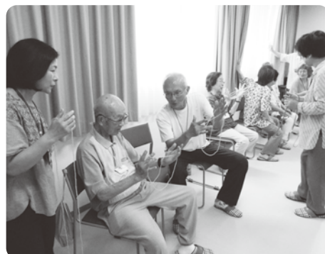
時には、昔を思い出してあやとり! 少ないですが、男性参加者もいますよ。