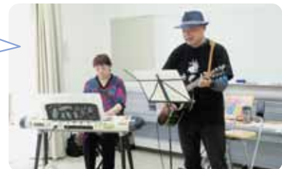
みんなで歌おう会の様子