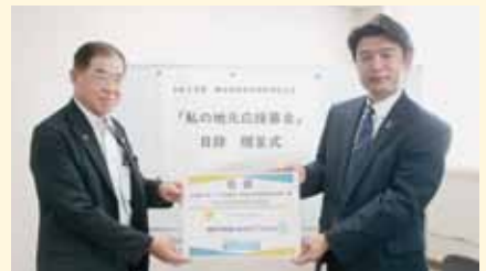
明治安田生命保険相互会社 名古屋東支社 様 「私の地元応援募金」寄付金贈呈式を行いました。