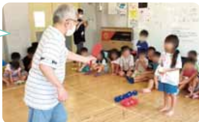
ポッチャの審判の様子