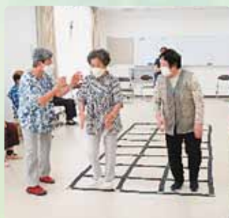
ふまねっせ運動をサロンで指導