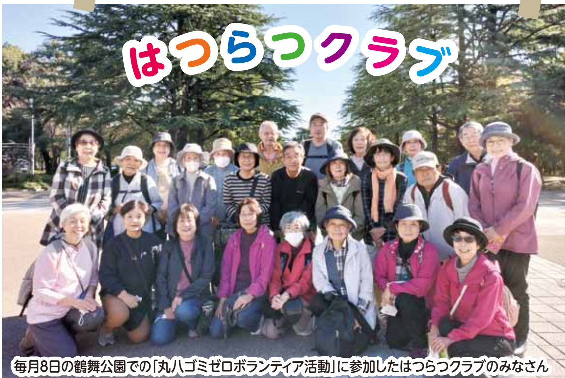
毎月8日の鶴舞公園での「丸八ゴミゼロボランティア活動」に参加したはつらつクラブのみなさん

はつらつクラブは健康体操、レクリエーション、音楽などを楽しみながら【介護予防】についての理解を深めるとともに仲間づくりをすすめ、いきいきとした生活を過ごすことができるようにする活動です。