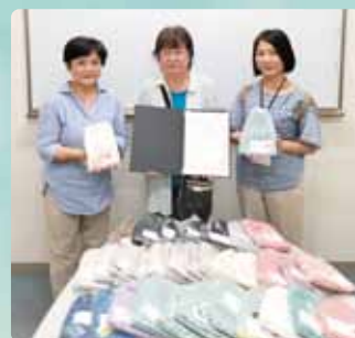
毛糸の帽子を名古屋市立大学病院のがんを患う方に寄付

はつらつクラブの参加者から赤い羽根共同募金へ31,075円のご寄付をいただきました。