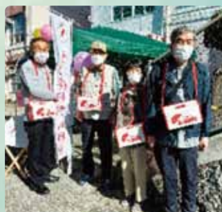
赤い羽根共同募金運動に参加