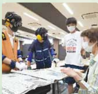
学校での福祉教育授業の手伝い