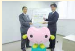
明治安田生命保険相互会社名古屋東支社様より寄付金をいただきました