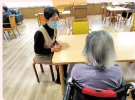
▲傾聴をするこころん昭和のお二人の様子