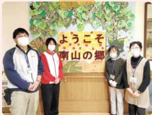
▲こころん昭和のお二人と南山の郷の職員さん

南山の郷の職員さんは、「ゆっくり時間をかけてご利用者のお話を聴いてくださり、有り難いと思っています。ボランティアさんとご利用者の年代が近く、職員では分からないような昔の話もして下さることで、ご利用者の共感やなつかしさを引き出してください、ご利用者も嬉しそうに話しておられます。また、普段発語が無い方が話をされている姿もみかけて、職員もご利用者について新しい発見があります」とお話しくださいました。