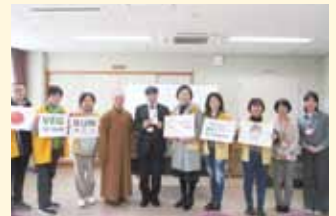
国際ブリアー様より寄付金と「VEG RAN」の取り組みによるお米とお菓子の寄付をいただきました