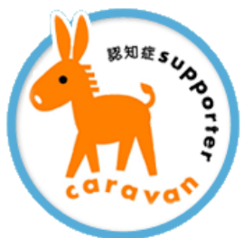
認知症サポーターキャラバン